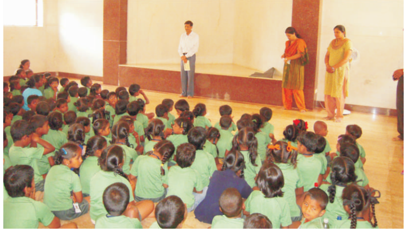
ಮಕ್ಕಳ ದಿನಾಚರಣೆಯ ದಿನದಂದು ತಪೋನಗರದ ವಿಶ್ವ ಚೇತನ ಮಂದಿರದಲ್ಲಿ ಲೈಟ್ ಚಾನಲಿಂಗ್ ಮಾಡುತ್ತಿರುವುದು