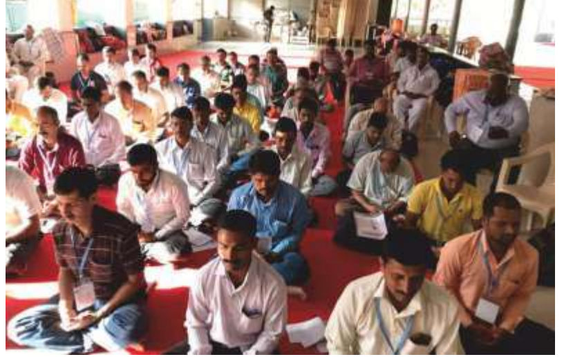
ಪುಣೆಯಲ್ಲಿನ ಆರ್ ಎಸ್ ಎಸ್ (RSS) ನ ಸದಸ್ಯರು ಏಪ್ರಿಲ್ 16, 2017ರಂದು ಲೈಟ್ ಚಾನಲ್ ಮಾಡುತ್ತಿರುವುದು