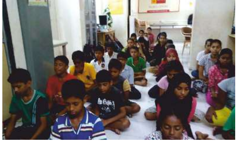
ಊರ್ಲಿಯಲ್ಲಿನ 'ಲೈಟ್ ಆಫ್ ಲೈಟ್ ಟ್ರಸ್ಟ್ ಗ್ರೂಪ್' ಸದಸ್ಯರು ಆಗಸ್ಟ್ 19 ರಂದು ಬೆಳಕನ್ನು ಚಾನಲ್ ಮಾಡುತ್ತಿರುವುದು

ಲಕ್ಷಾಂತರ ಜನರು ನಿಯತವಾದ ಲೈಟ್ ಚಾನಲಿಂಗ್ ಅಭ್ಯಾಸದಿಂದ ಪ್ರಯೋಜನಗಳನ್ನು ಪಡೆದಿದ್ದಾರೆ. ಅನೇಕರು ಸೋಜಿಗವೆನಿಸುವಂತಹ ಸಹಾಯವನ್ನು ಹಾಗೂ ಅದ್ಭುತವಾದ ಅನುಭವಗಳನ್ನು ಪಡೆದಿದ್ದಾರೆ. ನಿಮ್ಮ ಅನುಭವಗಳು ಇತರರಿಗೆ ಸ್ಪೂರ್ತಿ ನೀಡಬಹುದು ಹಾಗೂ ಮಾರ್ಗದರ್ಶನ ಕೂಡ ಮಾಡಬಹುದು. ದಯವಿಟ್ಟು ನಿಮ್ಮ ಅನುಭವಗಳನ್ನು ನಮ್ಮ ಜೊತೆ ಹಂಚಿಕೊಳ್ಳಿ. ನಮ್ಮ ಇ-ಮೇಲ್ info@lightagemasters.com ಗೆ ಬರೆಯಿರಿ.