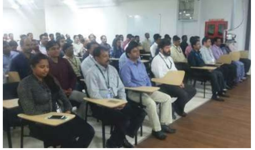
ಬೆಂಗಳೂರಿನ IBM ಕಂಪನಿಯ ಉದ್ಯೋಗಿಗಳು ಡಿಸೆಂಬರ್ 13, 2017 ರಂದು ಬೆಳಕನ್ನು ಚಾನಲ್ ಮಾಡುತ್ತಿರುವುದು

ಲಕ್ಷಾಂತರ ಜನರು ನಿಯತವಾದ ಲೈಟ್ ಚಾನಲಿಂಗ್ ಅಭ್ಯಾಸದಿಂದ ಪ್ರಯೋಜನಗಳನ್ನು ಪಡೆದಿದ್ದಾರೆ. ಅನೇಕರು ಸೋಜಿಗವೆನಿಸುವಂತಹ ಸಹಾಯವನ್ನು ಹಾಗೂ ಅದ್ಭುತವಾದ ಅನುಭವಗಳನ್ನು ಪಡೆದಿದ್ದಾರೆ. ನಿಮ್ಮ ಅನುಭವಗಳು ಇತರರಿಗೆ ಸ್ಪೂರ್ತಿ ನೀಡಬಹುದು ಹಾಗೂ ಮಾರ್ಗದರ್ಶನ ಕೂಡ ಮಾಡಬಹುದು. ದಯವಿಟ್ಟು ನಿಮ್ಮ ಅನುಭವಗಳನ್ನು ನಮ್ಮ ಜೊತೆ ಹಂಚಿಕೊಳ್ಳಿ. ನಮ್ಮ ಇ-ಮೇಲ್ info@lightagemasters.com ಗೆ ಬರೆಯಿರಿ.