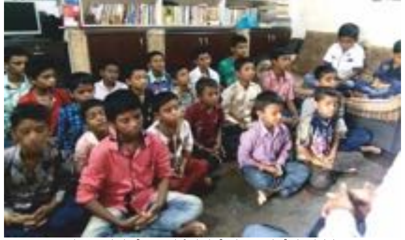
ಮಹಾರಾಷ್ಟ್ರದ ಭೊಸಾರಿಯಲ್ಲಿರುವ ಸ್ನೇಹವಾನ್ ಸಂಸ್ಥೆಯ ಮಕ್ಕಳು ಆಗಸ್ಟ್ 26, 2018ರಂದು ಲೈಟ್ ಚಾನಲ್ ಮಾಡುತ್ತಿರುವುದು