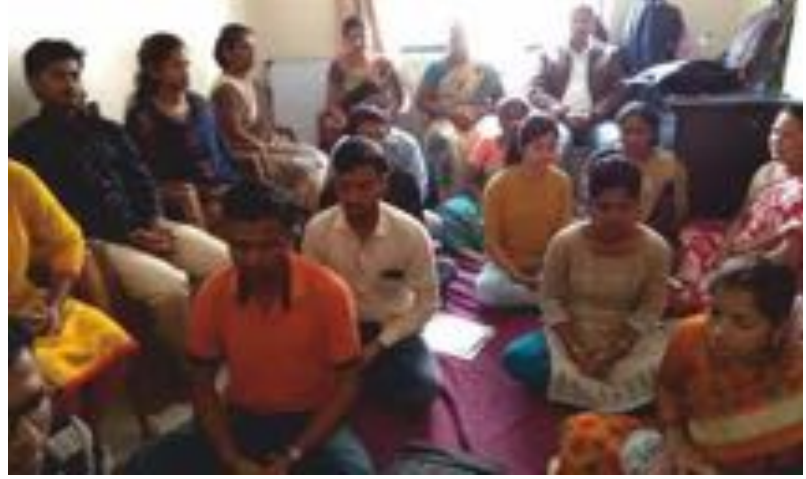
ಹಡಪ್ಪರ್‌ನಲ್ಲಿರುವ ಮಶಾಲ್ ಫೌಂಡೇಷನ್‌ನ ಶಿಕ್ಷಕರು ಜೂನ್ 28, 2018ರಂದು ಲೈಟ್ ಚಾನಲ್ ಮಾಡುತ್ತಿರುವುದು

ಲಕ್ಷಾಂತರ ಜನರು ನಿಯತವಾದ ಲೈಟ್ ಚಾನಲಿಂಗ್ ಅಭ್ಯಾಸದಿಂದ ಪ್ರಯೋಜನಗಳನ್ನು ಪಡೆದಿದ್ದಾರೆ. ಅನೇಕರು ಸೋಜಿಗವೆನಿಸುವಂತಹ ಸಹಾಯವನ್ನು ಹಾಗೂ ಅದ್ಭುತವಾದ ಅನುಭವಗಳನ್ನು ಪಡೆದಿದ್ದಾರೆ. ನಿಮ್ಮ ಅನುಭವಗಳು ಇತರರಿಗೆ ಸ್ಪೂರ್ತಿ ನೀಡಬಹುದು ಹಾಗೂ ಮಾರ್ಗದರ್ಶನ ಕೂಡ ಮಾಡಬಹುದು. ದಯವಿಟ್ಟು ನಿಮ್ಮ ಅನುಭವಗಳನ್ನು ನಮ್ಮ ಜೊತೆ ಹಂಚಿಕೊಳ್ಳಿ. ನಮ್ಮ ಇ-ಮೇಲ್ info@lightagemasters.com ಗೆ ಬರೆಯಿರಿ.