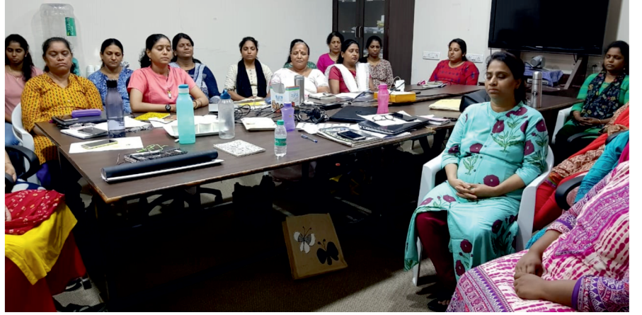
ಮುಂಬೈನ ಪ್ರಥಮ್ ಫೌಂಡೇಷನ್‌ನ ಸದಸ್ಯರು ಜೂನ್ 7, 2019ರಂದು ಲೈಟ್ ಚಾನಲ್ ಮಾಡುತ್ತಿರುವುದು

ಲಕ್ಷಾಂತರ ಜನರು ನಿಯತವಾದ ಲೈಟ್ ಚಾನಲಿಂಗ್ ಅಭ್ಯಾಸದಿಂದ ಪ್ರಯೋಜನಗಳನ್ನು ಪಡೆದಿದ್ದಾರೆ. ಅನೇಕರು ಸೋಜಿಗವೆನಿಸುವಂತಹ ಸಹಾಯವನ್ನು ಹಾಗೂ ಅದ್ಭುತವಾದ ಅನುಭವಗಳನ್ನು ಪಡೆದಿದ್ದಾರೆ. ನಿಮ್ಮ ಅನುಭವಗಳು ಇತರರಿಗೆ ಸ್ಪೂರ್ತಿ ನೀಡಬಹುದು ಹಾಗೂ ಮಾರ್ಗದರ್ಶನ ಕೂಡ ಮಾಡಬಹುದು. ದಯವಿಟ್ಟು ನಿಮ್ಮ ಅನುಭವಗಳನ್ನು ನಮ್ಮ ಜೊತೆ ಹಂಚಿಕೊಳ್ಳಿ. ನಮ್ಮ ಇ-ಮೇಲ್ info@lightagemasters.com ಗೆ ಬರೆಯಿರಿ.