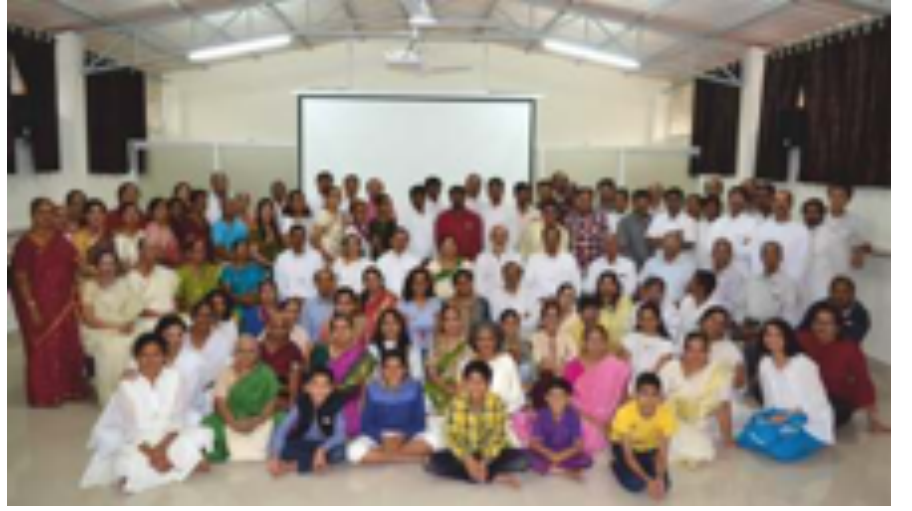
2019ರ ವಿಶ್ವ ಚಾನಲ್ಸ್ ದಿನದ ಯಶಸ್ವಿನ ಸಂಭ್ರಮಾಚರಣೆಯಲ್ಲಿ ಭಾಗವಹಿಸಿದ ಕಾರ್ಯಕರ್ತರು

ಲಕ್ಷಾಂತರ ಜನರು ನಿಯತವಾದ ಲೈಟ್ ಚಾನಲಿಂಗ್ ಅಭ್ಯಾಸದಿಂದ ಪ್ರಯೋಜನಗಳನ್ನು ಪಡೆದಿದ್ದಾರೆ. ಅನೇಕರು ಸೋಜಿಗವೆನಿಸುವಂತಹ ಸಹಾಯವನ್ನು ಹಾಗೂ ಅದ್ಭುತವಾದ ಅನುಭವಗಳನ್ನು ಪಡೆದಿದ್ದಾರೆ. ನಿಮ್ಮ ಅನುಭವಗಳು ಇತರರಿಗೆ ಸ್ಫೂರ್ತಿ ನೀಡಬಹುದು ಹಾಗೂ ಮಾರ್ಗದರ್ಶನ ಕೂಡ ಮಾಡಬಹುದು. ದಯವಿಟ್ಟು ನಿಮ್ಮ ಅನುಭವಗಳನ್ನು ನಮ್ಮ ಜೊತೆ ಹಂಚಿಕೊಳ್ಳಿ. ನಮ್ಮ ಇ-ಮೇಲ್ info@lightagemasters.com ಗೆ ಬರೆಯಿರಿ.