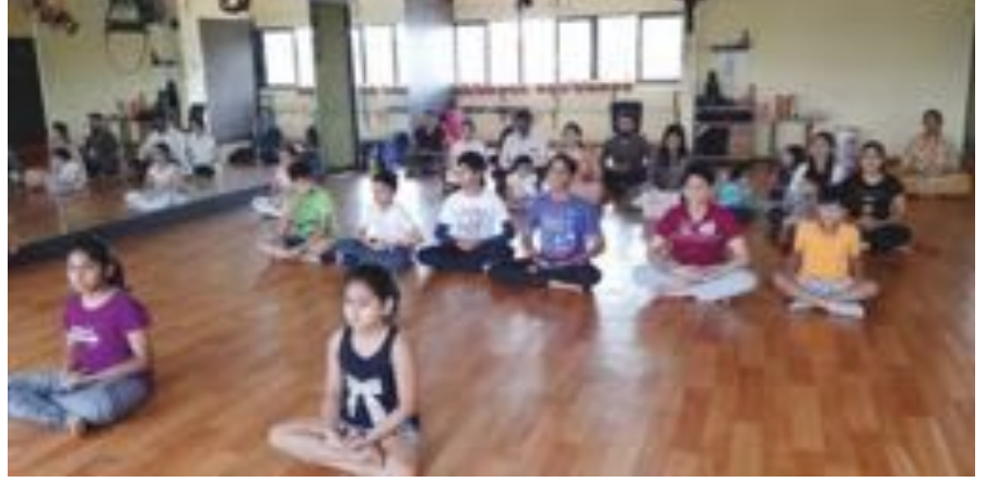
ಬೆಂಗಳೂರಿನ ಮಹಾಲಕ್ಷ್ಮಿ ಬಡಾವಣೆಯಲ್ಲಿರುವ 'ಮೈಂಡ್ ಬಾಡಿ ಆಂಡ್ ಬಿಯಾಂಡ್ ಫಿಟ್ನೆಸ್ ಸ್ಪೂಡಿಯೋ' ಸಂಸ್ಥೆಯ ಸದಸ್ಯರು ಏಪ್ರಿಲ್ 5, 2019ರಂದು ಲೈಟ್ ಚಾನಲ್ ಮಾಡುತ್ತಿರುವುದು

ಲಕ್ಷಾಂತರ ಜನರು ನಿಯತವಾದ ಲೈಟ್ ಚಾನಲಿಂಗ್ ಅಭ್ಯಾಸದಿಂದ ಪ್ರಯೋಜನಗಳನ್ನು ಪಡೆದಿದ್ದಾರೆ. ಅನೇಕರು ಸೋಜಿಗವೆನಿಸುವಂತಹ ಸಹಾಯವನ್ನು ಹಾಗೂ ಅದ್ಭುತವಾದ ಅನುಭವಗಳನ್ನು ಪಡೆದಿದ್ದಾರೆ. ನಿಮ್ಮ ಅನುಭವಗಳು ಇತರರಿಗೆ ಸ್ಪೂರ್ತಿ ನೀಡಬಹುದು ಹಾಗೂ ಮಾರ್ಗದರ್ಶನ ಕೂಡ ಮಾಡಬಹುದು. ದಯವಿಟ್ಟು ನಿಮ್ಮ ಅನುಭವಗಳನ್ನು ನಮ್ಮ ಜೊತೆ ಹಂಚಿಕೊಳ್ಳಿ. ನಮ್ಮ ಇ-ಮೇಲ್ info@lightagemasters.com ಗೆ ಬರೆಯಿರಿ.