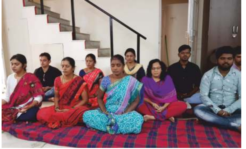
ಮುಂಬೈನಲ್ಲಿರುವ ಲಾಡಿ ಫೌಂಡೇಶನ್‌ನ ಮೇಲ್ವಿಚಾರಕರು (Supervisors) 22-12-2019ರಂದು ಲೈಟ್ ಚಾನಲ್ ಮಾಡುತ್ತಿರುವುದು

ಲಕ್ಷಾಂತರ ಜನರು ನಿಯತವಾದ ಲೈಟ್ ಚಾನಲಿಂಗ್ ಅಭ್ಯಾಸದಿಂದ ಪ್ರಯೋಜನಗಳನ್ನು ಪಡೆದಿದ್ದಾರೆ. ಅನೇಕರು ಸೋಜಿಗವೆನಿಸುವಂತಹ ಸಹಾಯವನ್ನು ಹಾಗೂ ಅದ್ಭುತವಾದ ಅನುಭವಗಳನ್ನು ಪಡೆದಿದ್ದಾರೆ. ನಿಮ್ಮ ಅನುಭವಗಳು ಇತರರಿಗೆ ಸ್ಫೂರ್ತಿ ನೀಡಬಹುದು ಹಾಗೂ ಮಾರ್ಗದರ್ಶನ ಕೂಡ ಮಾಡಬಹುದು. ದಯವಿಟ್ಟು ನಿಮ್ಮ ಅನುಭವಗಳನ್ನು ನಮ್ಮ ಜೊತೆ ಹಂಚಿಕೊಳ್ಳಿ. ನಮ್ಮ ಇ-ಮೇಲ್ info@lightagemasters.com ಗೆ ಬರೆಯಿರಿ.