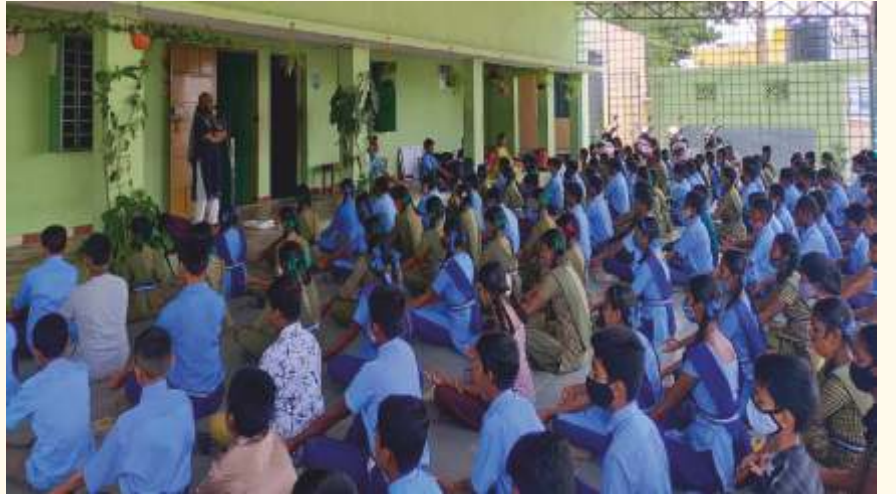
ಬೆಂಗಳೂರಿನ ಪ್ರೌಢಶಾಲೆಯೊಂದರ ವಿದ್ಯಾರ್ಥಿಗಳು ಜೂನ್ 6, 2022 ರಂದು ಲೈಟ್ ಚಾನಲ್ ಮಾಡಿದರು.