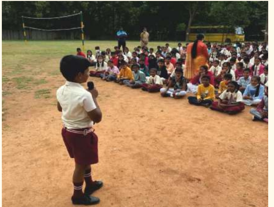
ಬೆಂಗಳೂರಿನ ಶಾಲೆಯೊಂದರ ವಿದ್ಯಾರ್ಥಿಯೊಬ್ಬರು ತಮ್ಮ ಲೈಟ್ ಚಾನಲಿಂಗ್ ಅನುಭವಗಳನ್ನು ತಮ್ಮ ಸಹಪಾಠಿಗಳ ಜೊತೆ ಜೂನ್ 17, 2022 ರಂದು ಹಂಚಿಕೊಂಡರು.