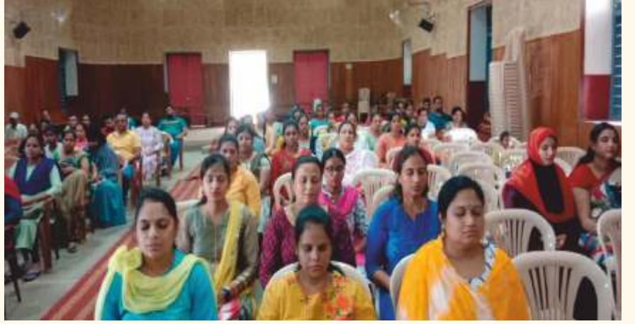
ತಿಪಟೂರಿನ ಕಲ್ಪತರು ಸೆಂಟ್ರಲ್ ಸ್ಕೂಲಿನ ವಿದ್ಯಾರ್ಥಿಗಳ ತಂದೆ ತಾಯಿಯರು ಮೇ 27, 2022 ರಂದು ಲೈಟ್ ಚಾನಲ್ ಮಾಡಿದರು.