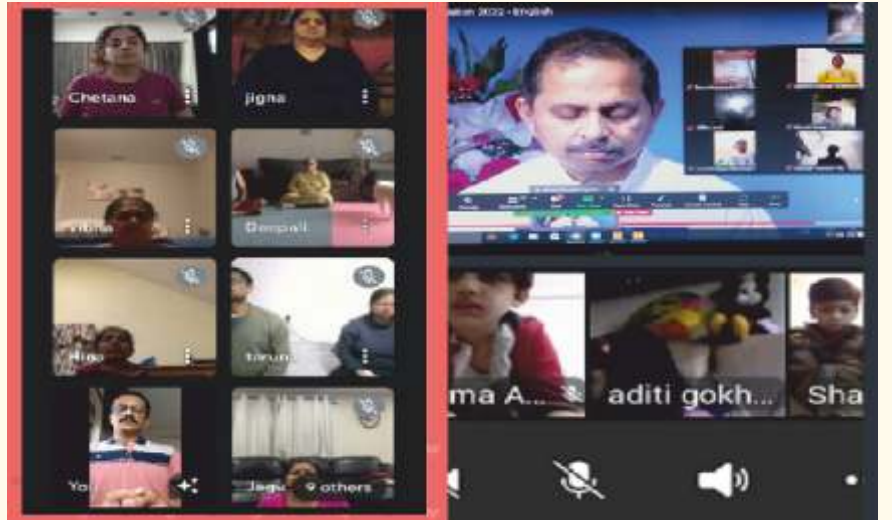
ಆನ್-ಲೈನ್ ಮೂಲಕ ನಡೆದ ಲೈಟ್ ಚಾನಲಿಂಗ್ ಸೆಷನ್‌ಗಳು