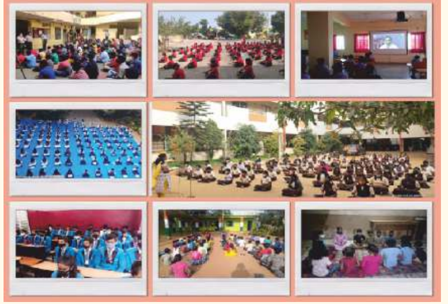
ಕರ್ನಾಟಕ ರಾಜ್ಯದ ಶಾಲೆಗಳಲ್ಲಿ ನಡೆದ ಲೈಟ್ ಚಾನಲಿಂಗ್ ಸೆಷನ್‌ಗಳು