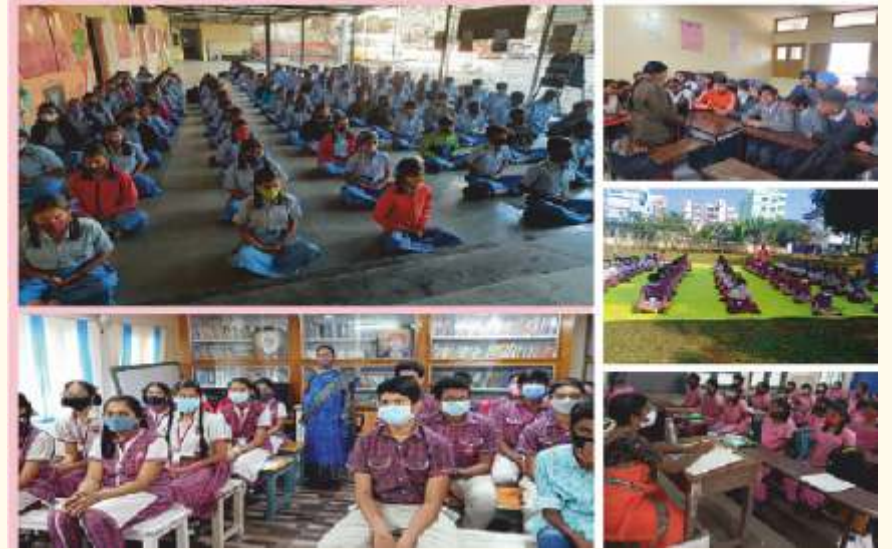
ಅಮೃತಸರ, ವಿಶಾಖಪಟ್ಟಣ, ಚೆನ್ನೈ, ಪುಣೆ ಹಾಗೂ ಹೈದರಾಬಾದ್ ನಗರಗಳ ಶಾಲೆಗಳಲ್ಲಿ ನಡೆದ ಲೈಟ್ ಚಾನಲಿಂಗ್ ಸೆಷನ್‌ಗಳು