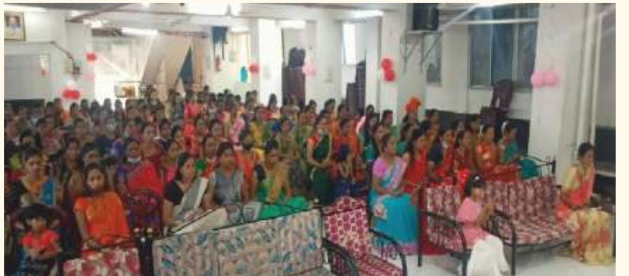
ಹುಣಿಯ ನಂದಿ ಫೌಂಡೇಶನ್ ಶಿಕ್ಷಕಿಯರು ಮಹಿಳಾ ದಿನಾಚರಣೆಯ ಅಂಗವಾಗಿ ಮಾರ್ಚ್ 8, 2022ರಂದು ಲೈಟ್ ಚಾನಲ್ ಮಾಡಿದರು.