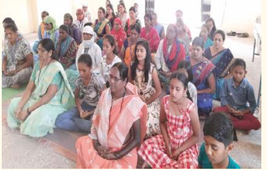
ಹುಣಿಯ ಚಕನ್ ಕಾರ್ಪೊರೇಷನ್ ನೌಕರರು ಮತ್ತು ಕೆಲವು ಮಕ್ಕಳು ಏಪ್ರಿಲ್ 11, 2022ರಂದು ಲೈಟ್ ಚಾನಲ್ ಮಾಡಿದರು.