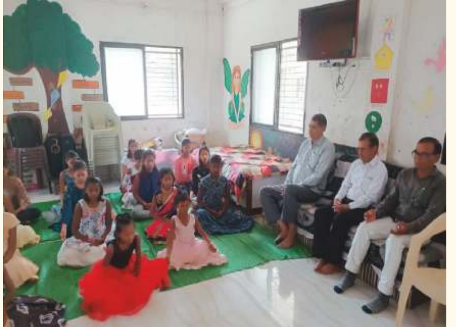
ಅಮರಾವತಿಯ ಹೆಲ್ತ್ ಕ್ಲಬ್‌ವೊಂದರ ಕೆಲವು ಮಕ್ಕಳು ಮತ್ತು ವಯಸ್ಕರು ಏಪ್ರಿಲ್ 15, 2022ರಂದು ಲೈಟ್ ಚಾನಲ್ ಮಾಡಿದರು.