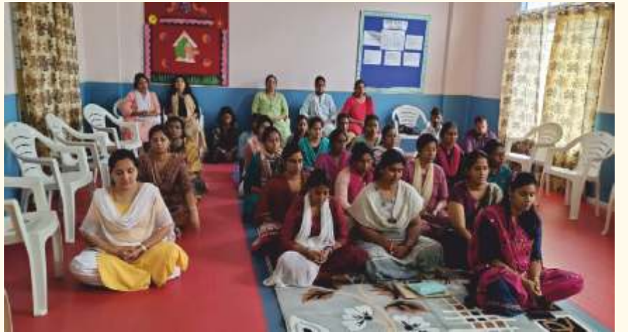
ಬೆಂಗಳೂರಿನ ವಾಗ್ಗೇವಿ ವಿಲಾಸ ಶಾಲೆಯ ಶಿಕ್ಷಕರು ಸೆಪ್ಟೆಂಬರ್ 21ರಂದು ಲೈಟ್ ಚಾನಲ್ ಮಾಡಿದರು