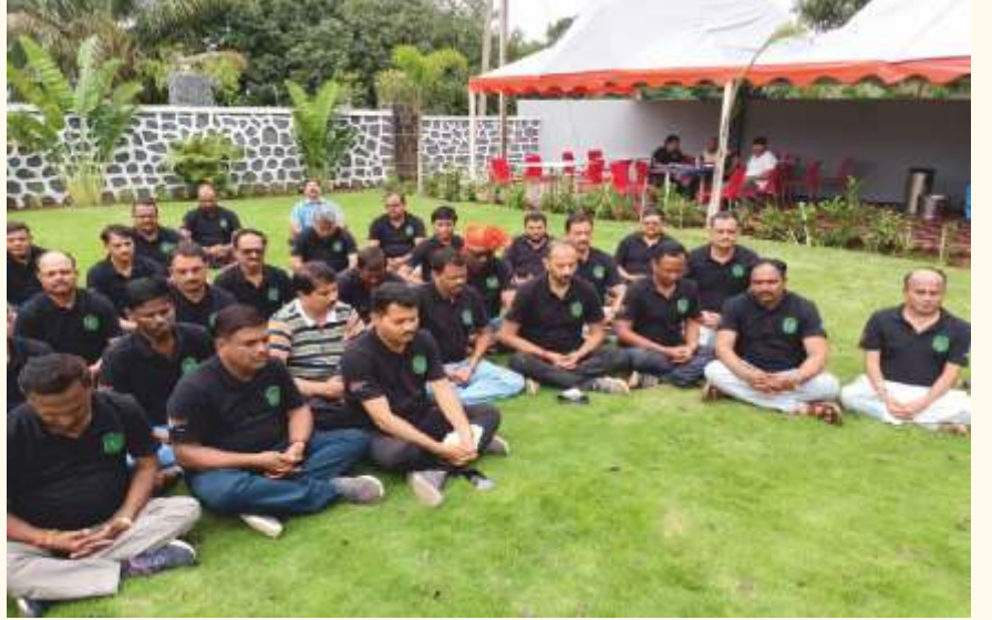
ಪುಣೆಯ ಕೃಷಿ ಕಾಲೇಜಿನ 1992ರ ಸಹಪಾಟಿಗಳ ತಂಡವು ಜುನ್ನಾರ್‌ನಲ್ಲಿರುವ ಗ್ರೇಪ್ಪಿ ಅಗ್ರಿ ಟ್ಯೂರಿಸ್ತ್ ಸೆಂಟರ್‌ನಲ್ಲಿ ಸೆಪ್ಟೆಂಬರ್ 11ರಂದು ಲೈಟ್ ಚಾನಲ್ ಮಾಡಿದರು.