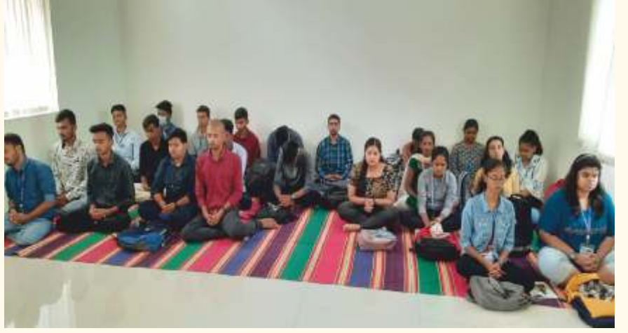
ಬೆಂಗಳೂರಿನ ಎಬೆನಿಜರ್ ಕಾಲೇಜಿನ ಪ್ರಥಮ ವರ್ಷದ BCA ವಿದ್ಯಾರ್ಥಿಗಳು ಆಗಸ್ಟ್ 18ರಂದು ಮಾನಸ ಫೌಂಡೇಶನ್‌ಗೆ ಭೇಟಿನೀಡಿ ಲೈಟ್ ಚಾನಲ್ ಮಾಡಿದರು.