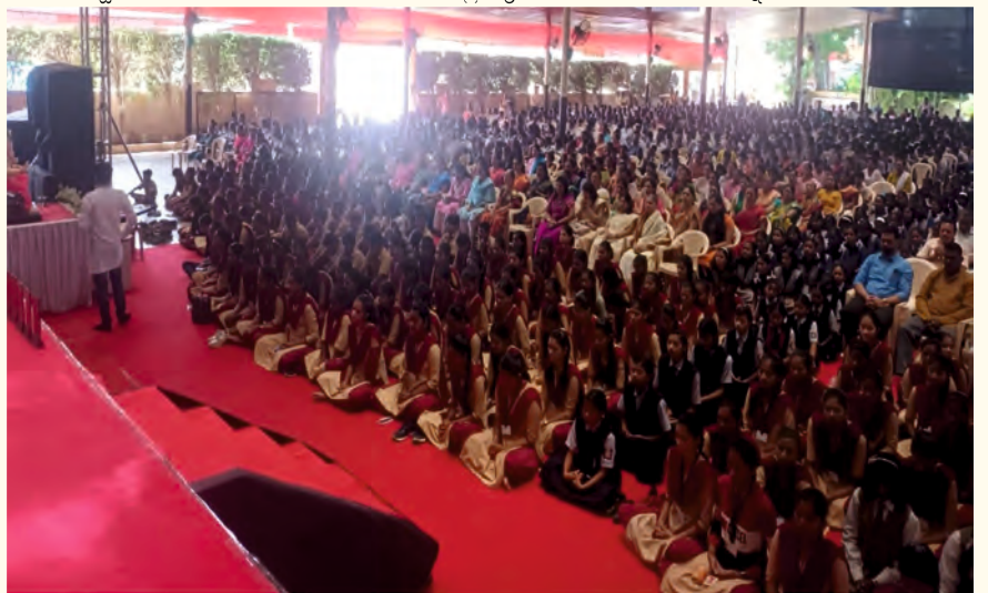
ಮಹಾರಾಷ್ಟ್ರದ ಅಹಮದ್‌ನಗರ ಜಿಲ್ಲೆಯ ಸಂಗಮ್‌ನಗರದಲ್ಲಿನ ಜನತೆಗೆ ಹಾಗೂ ಕೆಲವು ಶಾಲೆಗಳ ವಿದ್ಯಾರ್ಥಿಗಳು ಮತ್ತು ಶಿಕ್ಷಕರಿಗೆ ಸೆಪ್ಟೆಂಬರ್ 25, 2023ರಂದು ಲೈಟ್ ಚಾನಲಿಂಗ್ ಸೆಷನ್‌ಅನ್ನು ನಡೆಸಲಾಯಿತು.