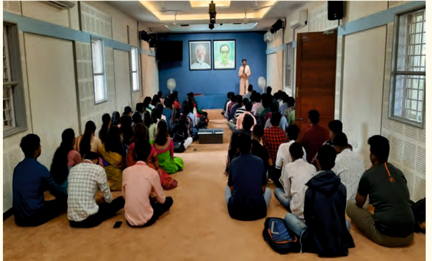
ಬೆಂಗಳೂರಿನ ವಿಜಯ ವಿಠಲ ತಾಂತ್ರಿಕ ಮಹಾವಿದ್ಯಾಲಯದ ಹೊಸ ವಿದ್ಯಾರ್ಥಿಗಳಿಗೆ ಸೆಪ್ಟೆಂಬರ್ 22, 2023ರಂದು ತಪೋನಗರದಲ್ಲಿ ಲೈಟ್ ಚಾನಲಿಂಗ್ ಸೆಷನ್‌ಅನ್ನು ನಡೆಸಲಾಯಿತು.