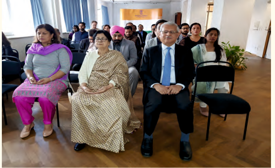
ಆಸ್ಪಿಯ ದೇಶದ ವಿಯೆನ್ನಾದಲ್ಲಿರುವ ಭಾರತೀಯ ರಾಯಭಾರ ಕಛೇರಿಯ ಸದಸ್ಯರು ಸೆಪ್ಟೆಂಬರ್ 1, 2023ರಂದು ಲೈಟ್ ಚಾನಲ್ ಮಾಡಿದರು.