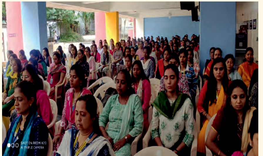
ಪುಣೆಯ ಶಿಕ್ಷಕಿಯರು ಜುಲೈ 21, 2023ರಂದು ಲೈಟ್ ಚಾನಲ್ ಮಾಡಿದರು.