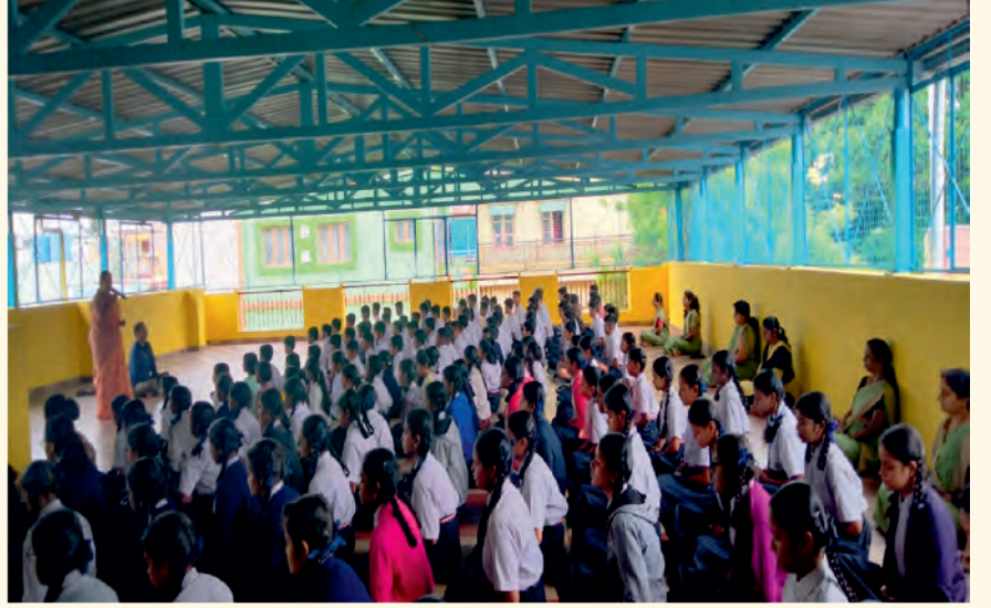
ಬೆಂಗಳೂರಿನ ರಾಜಾಜಿನಗರದಲ್ಲಿರುವ ಶಾಲೆಯೊಂದರಲ್ಲಿ ಜುಲೈ 22, 2023ರಂದು ಲೈಟ್ ಚಾನಲಿಂಗ್ ಸೆಷನ್‌ಅನ್ನು ನಡೆಸಲಾಯಿತು.