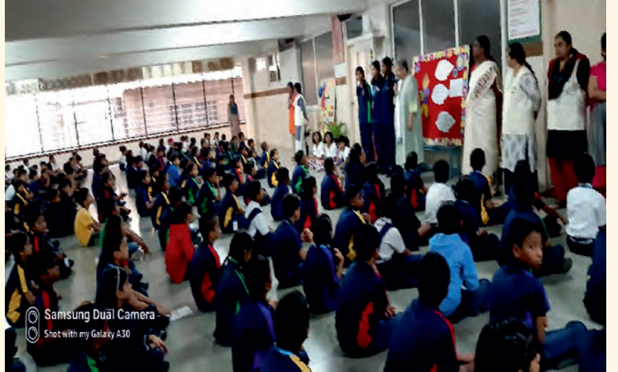
ಬೆಂಗಳೂರಿನ ಜಯನಗರದಲ್ಲಿರುವ ಶಾಲೆಯೊಂದರಲ್ಲಿ ಜುಲೈ 19, 2023ರಂದು ಲೈಟ್ ಚಾನಲಿಂಗ್ ಸೆಷನ್‌ಅನ್ನು ನಡೆಸಲಾಯಿತು.