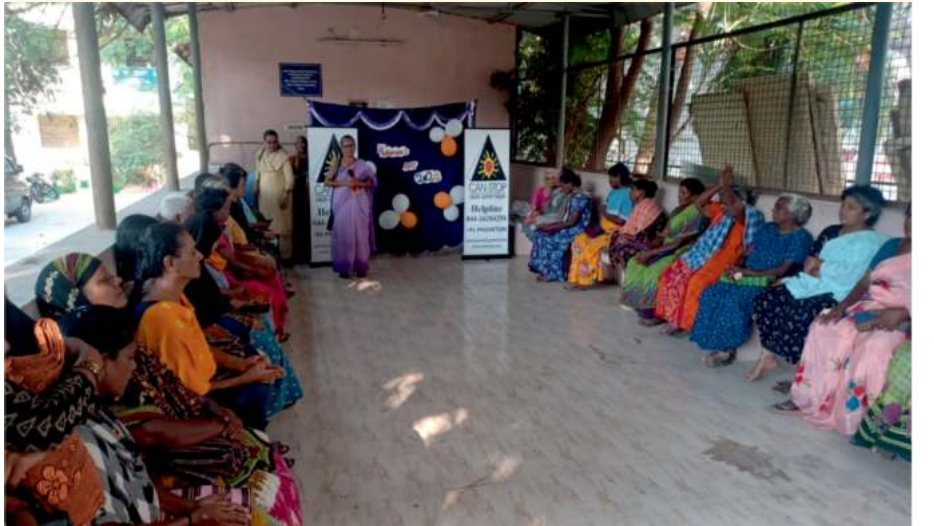
ಚೆನ್ನೈನಲ್ಲಿರುವ ಕ್ಯಾನ್ಸರ್ ರೋಗಿಗಳಿಗೆ 2024ರ ಮಾರ್ಚ್ ತಿಂಗಳಲ್ಲಿ ಒಂದು ಲೈಟ್ ಚಾನಲಿಂಗ್ ಸೆಷನ್‌ಅನ್ನು ನಡೆಸಲಾಯಿತು.