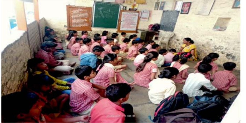
ಅಹಮದಾಬಾದ್‌ನ ಶಾಲೆಯೊಂದರ ವಿದ್ಯಾರ್ಥಿಗಳು 2024ರ ಮಾರ್ಚ್ ತಿಂಗಳಲ್ಲಿ ನಡೆದ ಲೈಟ್ ಚಾನಲಿಂಗ್ ಸೆಷನ್‌ನಲ್ಲಿ ಲೈಟ್ ಚಾನಲ್ ಮಾಡಿದರು.