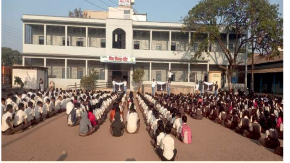
ಪುಣೆಯ ಶಾಲೆಯೊಂದರ ವಿದ್ಯಾರ್ಥಿಗಳು 2024ರ ಮಾರ್ಚ್ ತಿಂಗಳಲ್ಲಿ ನಡೆದ ಲೈಟ್ ಚಾನಲಿಂಗ್ ಸೆಷನ್‌ನಲ್ಲಿ ಭಾಗವಹಿಸಿದರು.